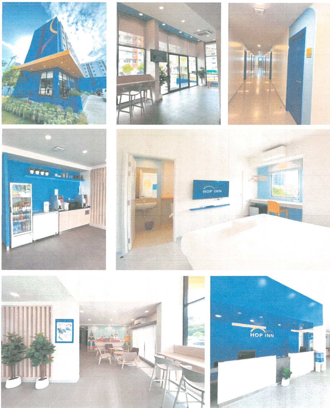
รูปภาพที่ 1.5 การใช้พื้นที่ของโครงการ