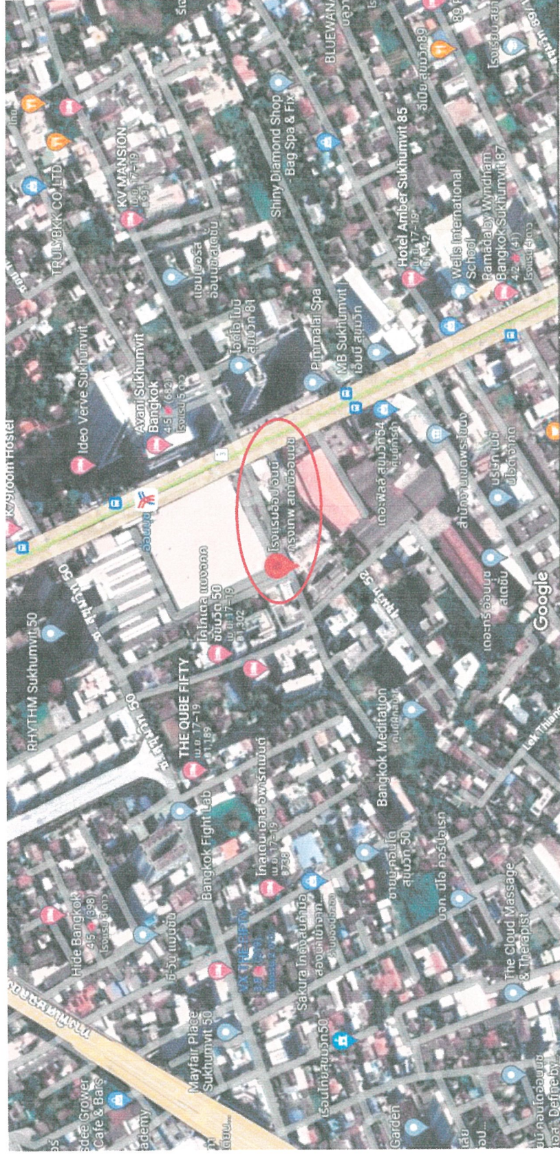
รูปภาพที่ 1.1 แผนที่ตั้งของโครงการ โรงแรม ซีโอ อินน์ กรุงเทพมหานคร (Top view)